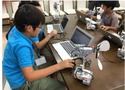
1号校「夙川校」の様子

プログラボ教育事業運営委員会では、プログラミング教育を通じて、日本の未来を担う子どもたちが、筋道立てて考える力や物ごとを深く考える力、目標に向かい最後までやり抜く力を身につけることで、将来、 自身の夢を実現し、関西から世界に羽ばたき活躍してほしい との願いの下、事業を運営しています。